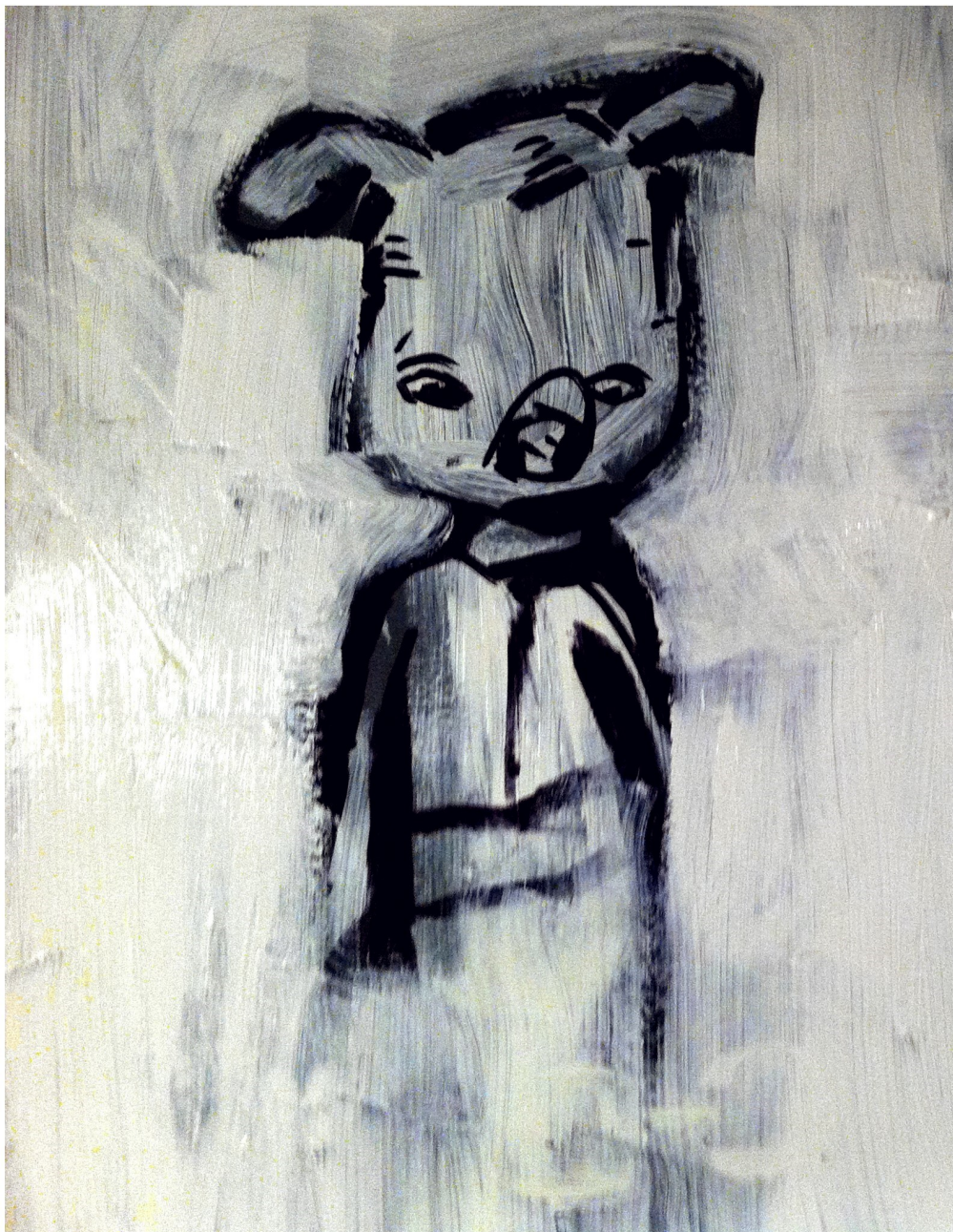
חזיר ננטש על קיר שירותי מועדון הדואר (2012) - הדר ראובן