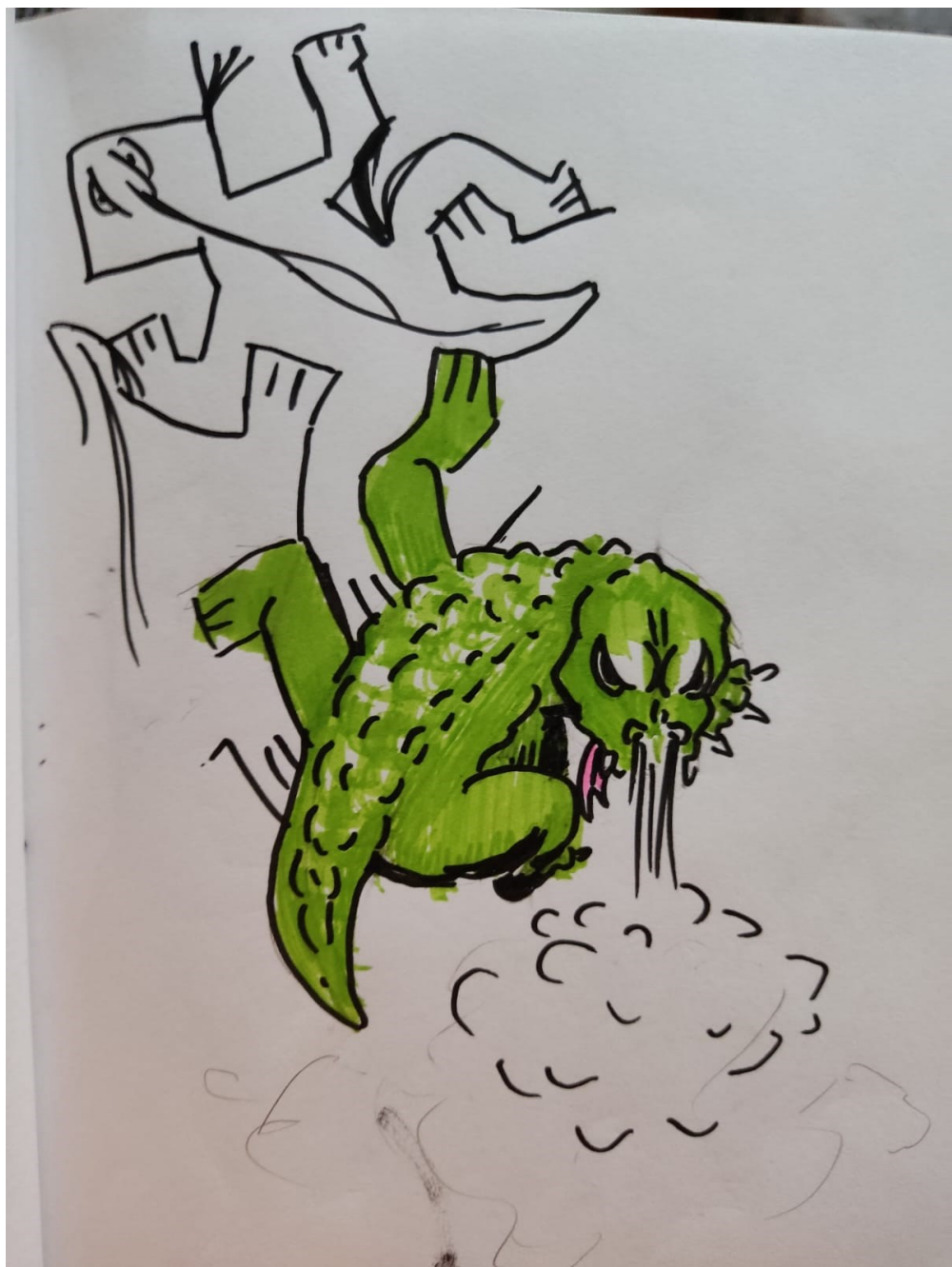
אחרי אשר (2016) - דפנה פאלק