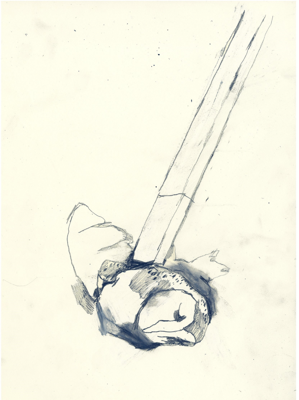
תאונת עבודה (2019) - הדר ראובן